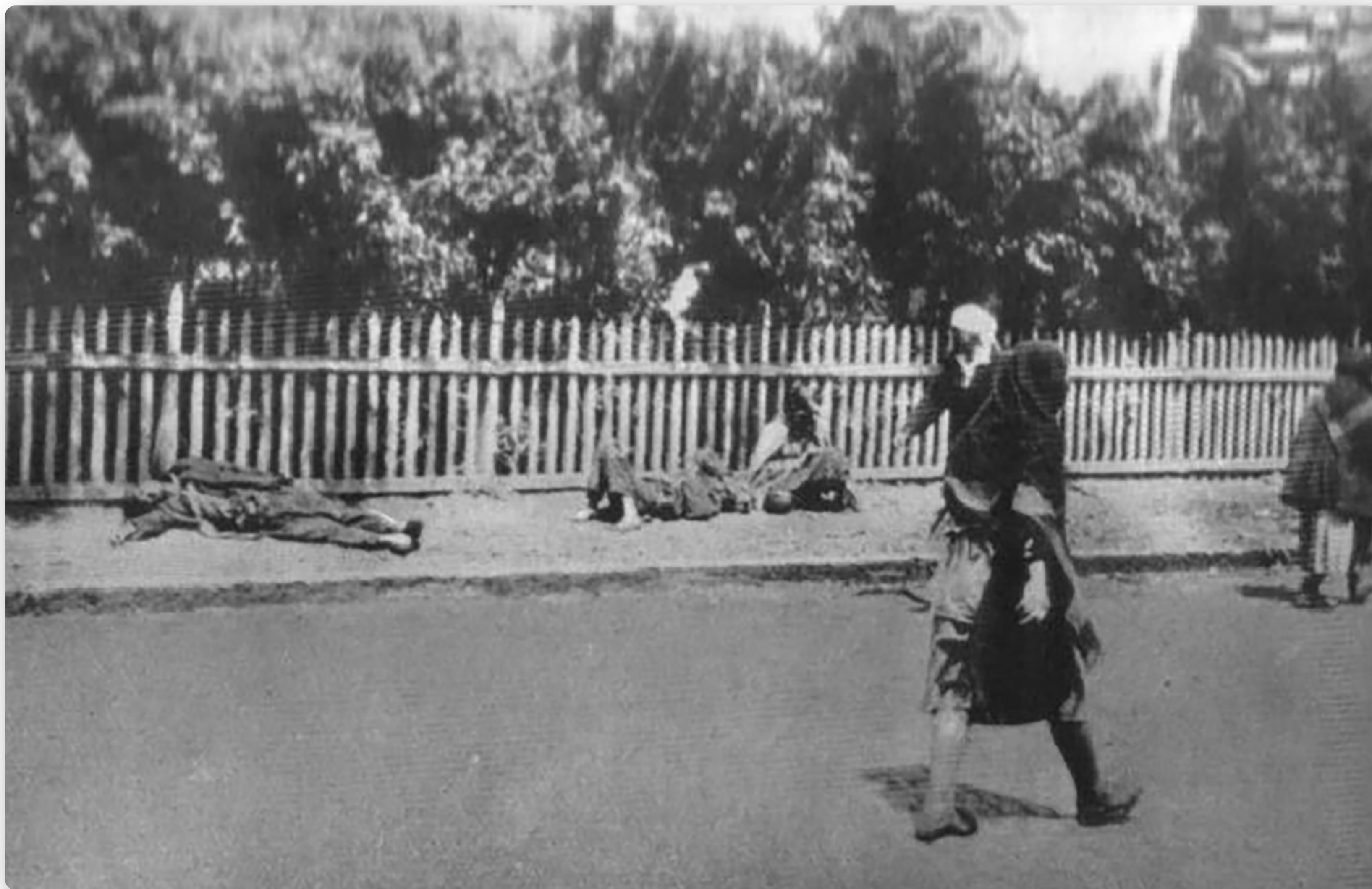
Oběti hladomoru v ulicích Charkova, snímek pořídil Alexander Wienerberger v roce 1933