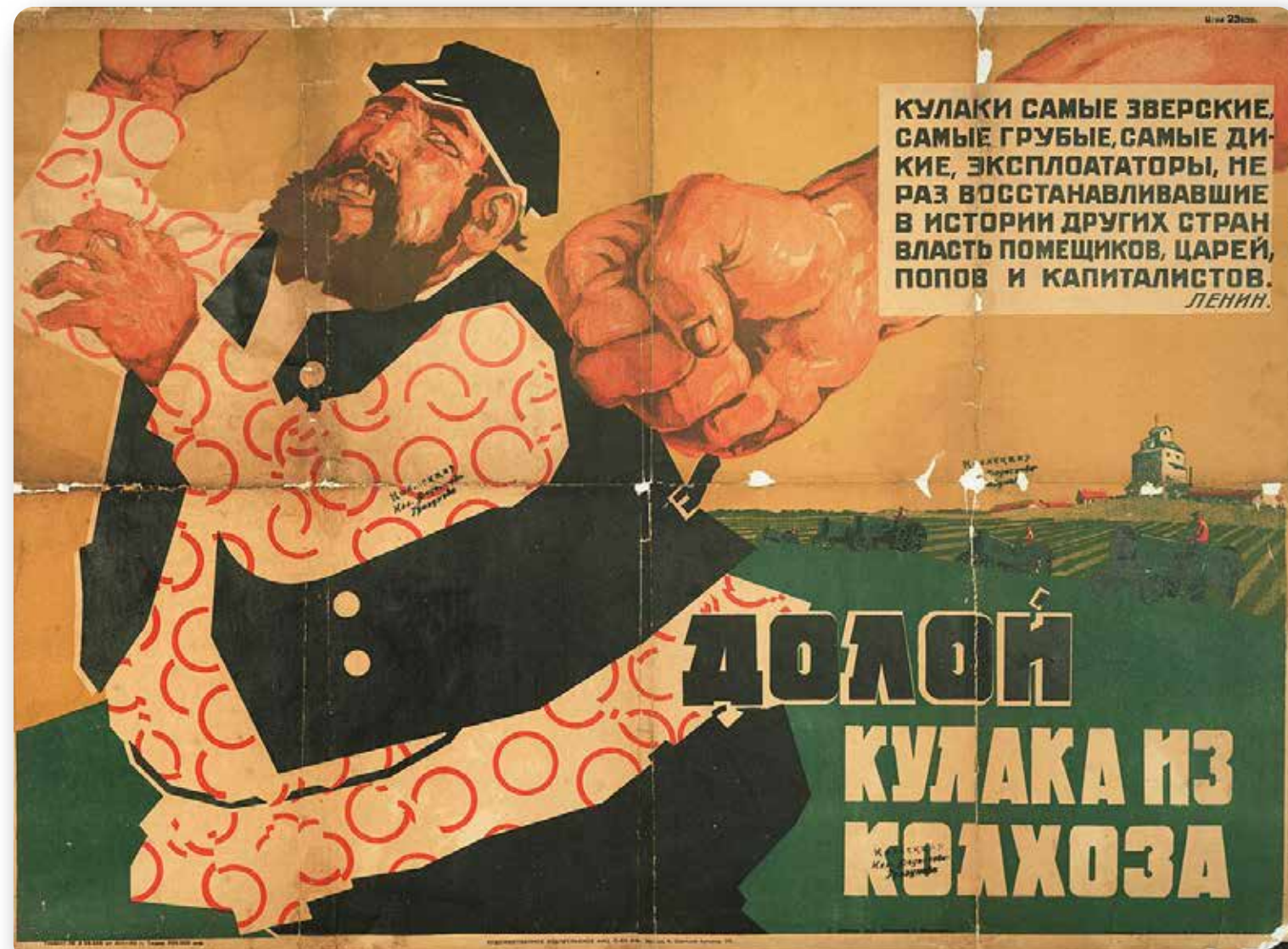
Propagandistický plakát „Pryč s kulaky z kolchozů“ rodmýchávající nenávist proti majetným zemědělcům

In den 1920er Jahren arbeiteten in der Sowjetunion 85 % der erwerbstätigen Bevölkerung in der Landwirtschaft. Die Kommunisten betrachteten die Landbevölkerung jedoch als rückständig, begrenzt und als Hindernis für die Entwicklung hin zu einer utopischen klassenlosen Gesellschaft, die sie als eine Gesellschaft der Städte und der Industrie sahen. Ihr Ziel war es, den ländlichen Raum durch die sogenannte Kollektivierung zu modernisieren und umzugestalten, d. h. durch den Beitritt privater Landwirte zu kollektiven Genossenschaften (Kolchosen) oder staatlichen Sowchosen. Dabei versuchten sie, das ideologische Schema des Klassenkampfes zu nutzen, mit dem sie die Bauern in arme, mittlere und reiche, sogenannte Kulaken, einteilten. Die Kollektivierung war jedoch in den 1920er Jahren nicht erfolgreich, und der Staat musste die private Wirtschaftstätigkeit der meisten Bauern auf dem Land tolerieren.